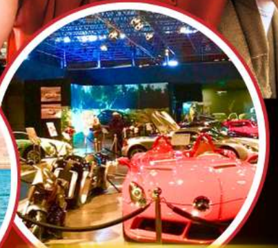
Royal Automobile Museum