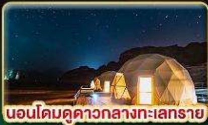
นอนโดมดูดาวกลางทะเลทราย

★ บินตรงสู่ “จอร์แดน” เยือน 7 มหัศจรรย์ของโลก