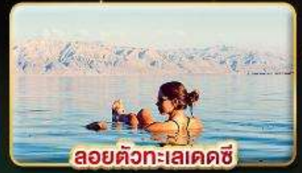
ลอยตัวทะเลเดคซี