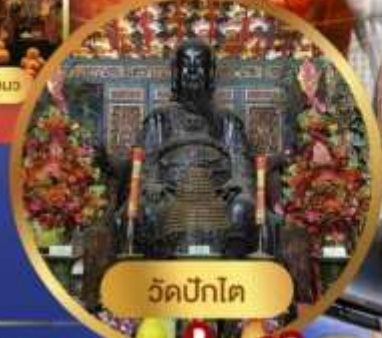
วัดปึกโต