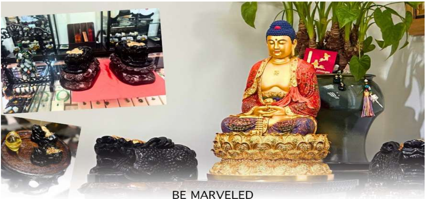
BE MARVELED គុណ័រឋីមើមះ