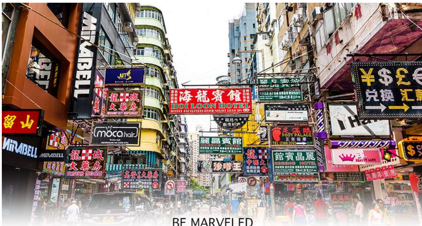
BE MARVELED MONGKOK

เครื่องสำอาง รองเท้า กระเป๋า เครื่องประดับมากมาย อีกทั้งยังมีร้านอาหาร และเครื่องดื่ม ที่ขึ้นชื่อหลากหลายชนิด ให้ทุกท่าน ได้ลองลิ้มรสอีกมากมาย