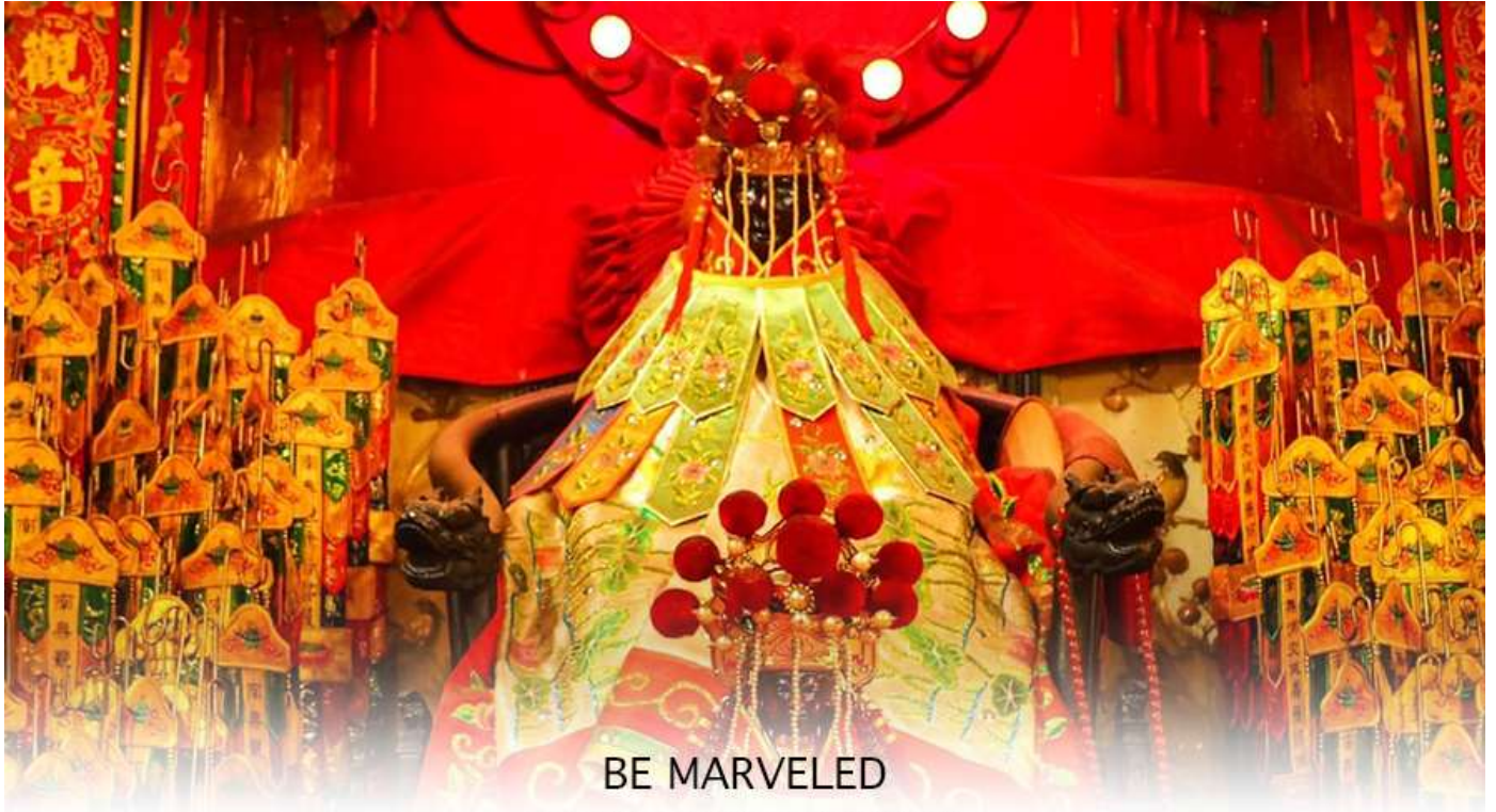
BE MARVELED วัดเจ้าแม่กวนอิมฮวงอ่า (ยิมเวิน)

ฮ่องกง-มาเก๊า จะมี "วันเปิดทรัพย์" หรือ "พิธียืมเงิน เจ้าแม่กวนอิมฮ่องกง" เป็นวันที่จะมาขอพรและยืมเงินเจ้าแม่กวนอิมซึ่งนับจากหลังวันตรุษจีน ไป 26 วัน จะเป็นวันเปิดทรัพย์ที่จัดขึ้นในทุกๆปี พิธีนี้จะมีเพียงครั้งปีละครั้งเท่านั้น เป็นวันสำคัญอีกวันที่คนหลังไหลมาไหว้ขอพรอย่างไม่ขาดสาย