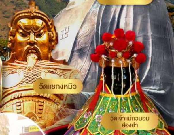
พระใหญ่เทียนถา