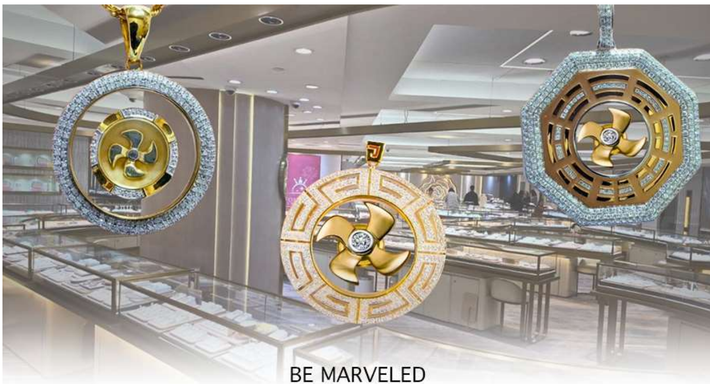
BE MARVELED ศูนย์อวรุญ กัณฑ์เศรษฐี

และนำท่านชม ศูนย์ปี่เซี่ยะ ซึ่งคนจีนนั้น ถือว่าหยกเป็นหิน ที่เป็นตัวแทนของความสวยงามและความบริสุทธิ์มีความเชื่อว่าหยก มงคล ถ้าพกติดตัวไว้จะอายุยืนและสุขภาพดีมีสินค้ำมากมายเกี่ยวกับหยก อาทิ กำไลหยก หรือสัตว์นำโชคอย่างปี่เซี่ยะ ให้ท่านได้เลือกซื้อเป็นของฝาก, ของที่ระลึก หรือของนำโชคแต่ตัวท่านเอง