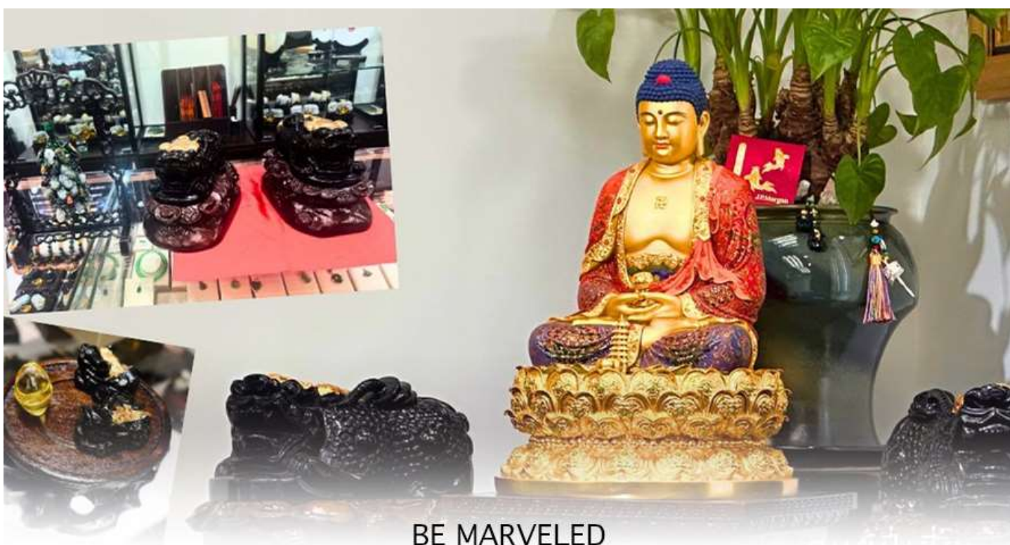
BE MARVELED ศูนย์ปี่เซี่ยะ

และนำท่านชม ศูนย์ปี่เซี่ยะ ซึ่งคนจีนนั้น ถือว่าหยกเป็นหิน ที่เป็นตัวแทนของความสวยงามและความบริสุทธิ์มีความเชื่อว่าหยก มงคล ถ้าพกติดตัวไว้จะอายุยืนและสุขภาพดีมีสินค้ำมากมายเกี่ยวกับหยก อาทิ กำไลหยก หรือสัตว์นำโชคอย่างปี่เซี่ยะ ให้ท่านได้เลือกซื้อเป็นของฝาก, ของที่ระลึก หรือของนำโชคแต่ตัวท่านเอง