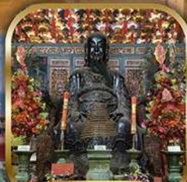
วัดปึกใต้