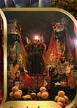
วัดนานโหมว