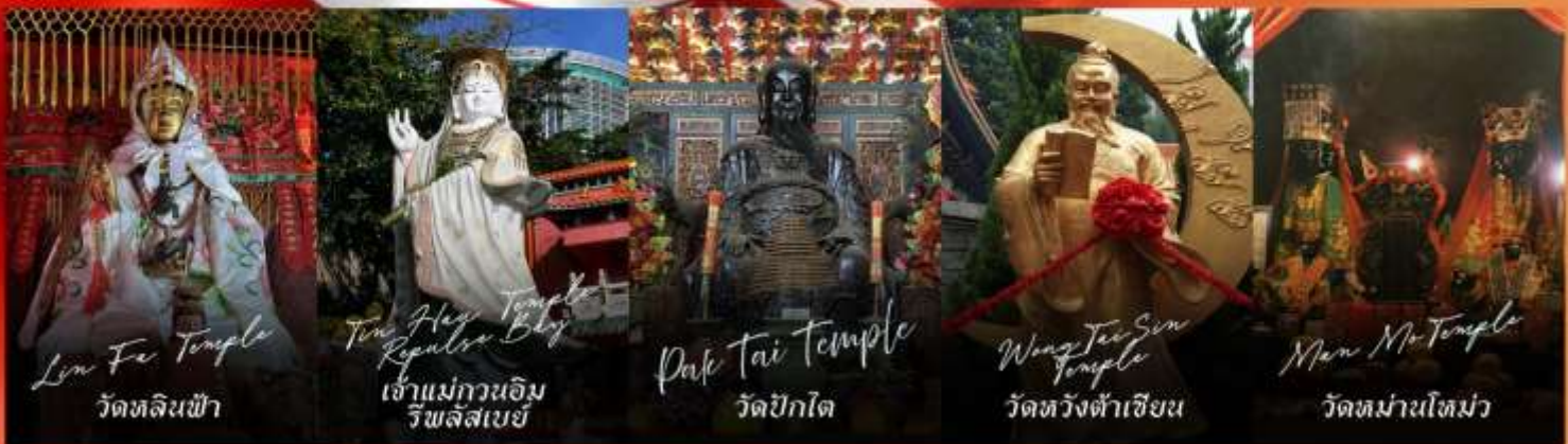
Lin Fe Temple วัดหลินฟ้า

รายการทัวร์ข้างต้นอาจมีการปรับเปลี่ยนเพื่อความเหมาะสม