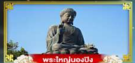
พระใหญ่ของปิง