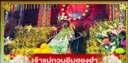
เจ้าแม่กวนอิมสองฮา

เที่ยว 2 เมือง ขึ้นไปมุกเกาะฮ่องกง เที่ยวจุฬาสวนสนุกและอควาเรียมที่ใหญ่ที่สุดในเอเชีย