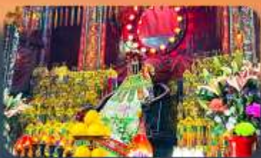
เจ้าแม่กวนอิมสองฮา