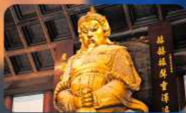
วัดเซ่งกงหมิว