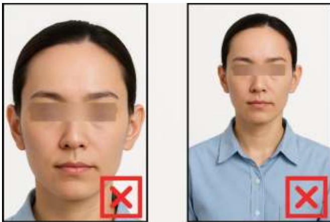
รูปที่ไม่ได้ขนาด ตามที่สถานทูตกำหนด