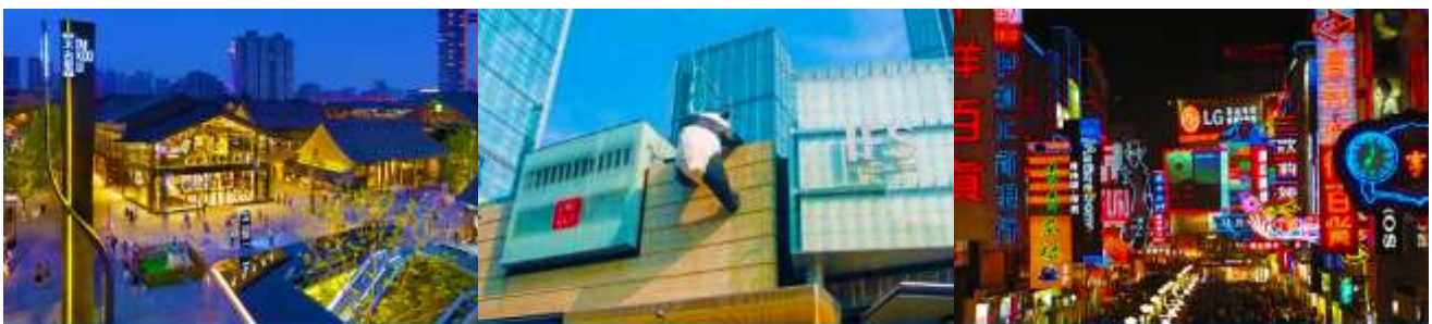
ถนนไท่กู๋หลี่ และวัดต้าฉือ