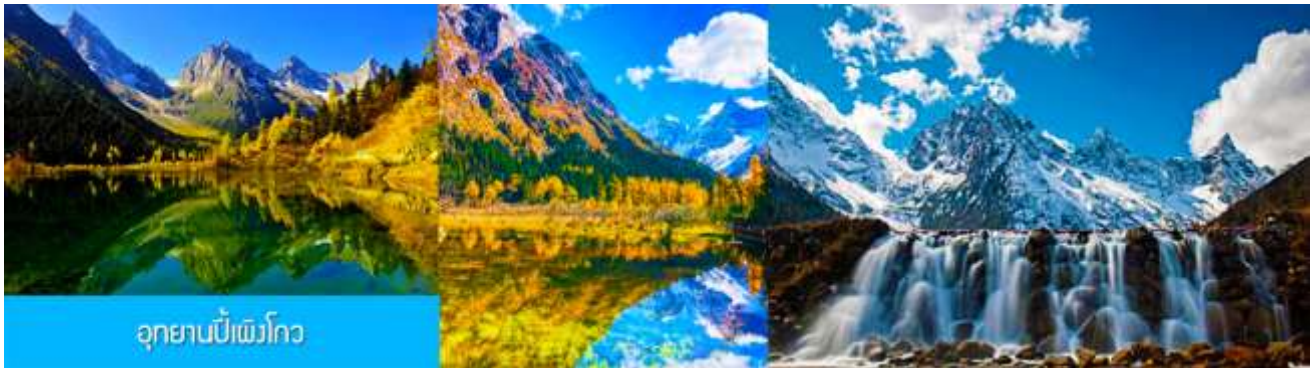
อุทยานบีเพิงโกว

หลังอาหารนำท่านเที่ยวชม อุทยานบีเพิงโกว 毕棚沟景区 ที่เป็นแหล่งท่องเที่ยวธรรมชาติที่สวยงามได้รับฉายาว่าเป็นสวิตเซอร์แลนด์แดนใต้แห่งเมืองเสฉวน ตั้งอยู่เหนือระดับน้ำทะเลระหว่าง 2,015 เมตร – 3,500 เมตร ครอบคลุมพื้นที่ 614 ตารางกิโลเมตร ได้รับการขึ้นทะเบียนเป็นอุทยานท่องเที่ยวธรรมชาติระดับ 4A ของจีนในปี ค.ศ. 2013 และกลายเป็นอุทยานท่องเที่ยวยอดนิยมที่มีนักท่องเที่ยวเดินทางมาเยือนในปี 2023 ... นำท่านขึ้นรถบัสของอุทยานเพื่อเข้าไปยังเขตอุทยาน นำท่านขึ้นรถกอล์ฟแวะเที่ยวจุดชมวิวสำคัญต่าง ๆ ภายในเขตอุทยาน ที่ประกอบด้วย ธารน้ำแข็งและภูเขาหิมะ โอบล้อมอุทยาน ทะเลสาบที่มีสีน้ำเขียวมรกต ป่าไม้ ลำธารน้ำใสสะอาด น้ำตก หุบเขาบนพื้นที่สูง ใบไม้เปลี่ยนสีและป่าไม้หลากสีในฤดูใบไม้ร่วง หุบดอกไม้อันฤดูใบไม้ผลิ โดยมีจุดชมวิวขึ้นชื่อต่าง ๆ อาทิ เขาอูฐ เขากระต่าย เขาสิงค์โต น้ำตกมังกรเขียว ทะเลสาบจิวหม่า และอ่าววงพระจันทร์ ฯลฯ จนครบแ่วเวลา นำคณะขึ้นรถบัสออกจากอุทยาน นำท่านเดินทางโดยรถบัสกลับเมืองคูเจียงเยียน