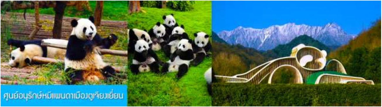
ศูนย์อนุรักษ์หมีแพนด้าเมืองตูเจียงเยียน

เช้า รับประทานอาหารเช้า ณ ห้องอาหารของโรงแรม (7) หลังอาหารเช้าท่านสามารถเลือกที่จะซื้อ โปรแกรมทัวร์เสริม หรืออิสระพักผ่อนตามอัธยาศัยใน โรงแรม