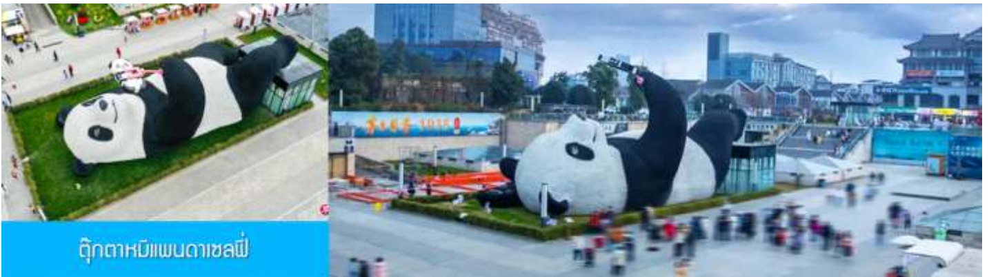
ตุ๊กตาหมีแพนด้าเซลฟี

เที่ยง รับประทานอาหารกลางวัน ณ ร้านอาหารพื้นเมือง (8)