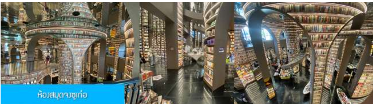
ห้องสมุดงูชู่เก๋