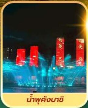
น้ำพุคังบาซี