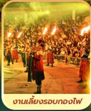
งานเลี้ยงรอบกองไฟ