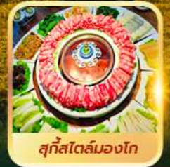
สุกีสโตลมองโก