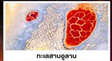
ทะเลสาบอูแลกัน