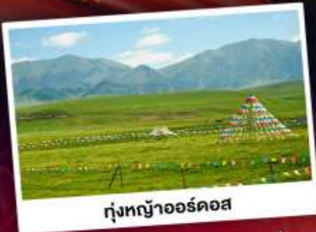
ทุ่งหญ้าออร์ดอส