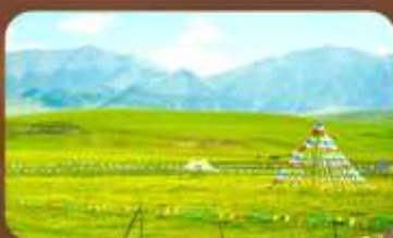
ทุ่งหญ้าออร์คอส