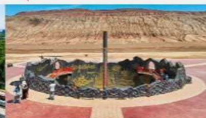
ภูเขาเปลวเพลิง

*ทางบริษัทฯ ขอสงวนสิทธิ์ในการส่งโปรแกรมทัวร์ตามความเหมาะสมขึ้นอยู่กับสถานการณ์ปัจจุบัน โดยคำนึงถึงผลประโยชน์ของลูกค้าเป็นสำคัญ