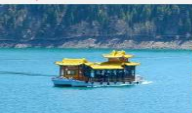
ล่องเรือทะเลสาบเกียนฉือ