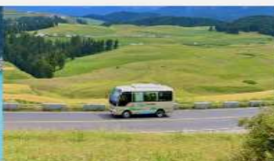
ทุ่งหญ้าเจียนปูลาเค่อ