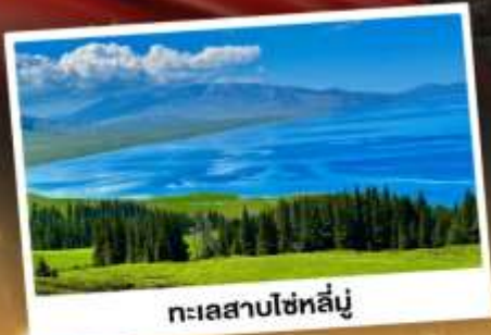
ทะเลสาบไซท์ลีนู๋

ชมวิวดอกคังการแบบยุโรปผสมเอเชีย กุ้งหนุ่ยาเขียวดำ ทะเลสาบสีเทอร์ควอยซ์