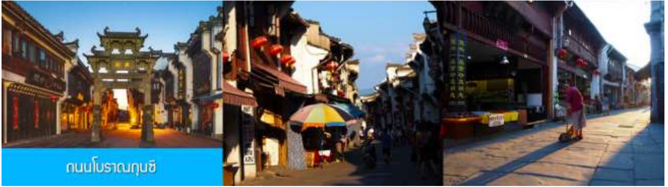
ถนนโบราณกุนซี

นำท่านเที่ยวชม ถนนโบราณกุนซี 屯溪老街 ถนนที่เป็นย่านการค้าโบราณในยุคราชวงศ์ซ่งได้แก่กว่า 700 ปี ถนนมีความยาวราว 1272 เมตร สองฝั่งถนนมีอาคารบ้านเรือนโบราณสไตล์หุยโจวที่สร้างในยุคปลายราชวงศ์หมิงและราชวงศ์ชิงที่ถูกอนุรักษ์ไว้เป็นอย่างดี ปัจจุบันยังมีห้างร้าน โบราณ อาทิ ร้านขายโบราณวัตถุ ร้านขายหยก ร้านขายภาพเขียนและอักษรพู่กันโบราณ ร้านอาหารพื้นเมือง ร้านขายของที่ระลึก ฯลฯ นอกจากนี้ร้านค้าและอาคารบ้านเรือน โบราณที่นี้ยังเป็นแหล่งรวมของนักท่องเที่ยวที่มาชิมอาหารพื้นเมือง เดินช้อปปิ้งและถ่ายภาพ เซ็คอิน