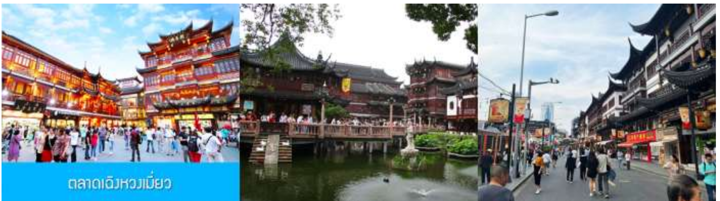
ตลาดเจิงหวงเมี่ยว

เช้า รับประทานอาหารเช้า ณ ห้องอาหารของโรงแรม (6)