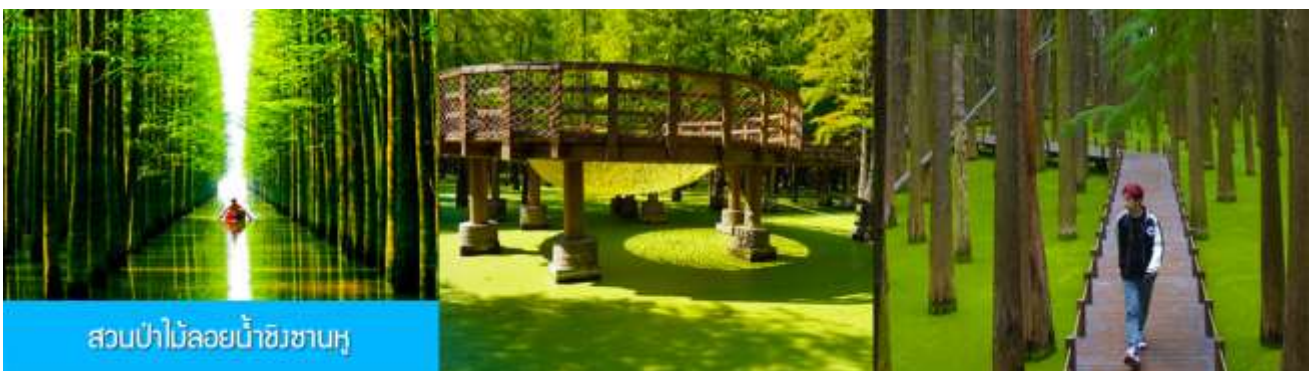
สวนป่าไม้ลอยน้ำชิงซานหู

หลังอาหารเช้าท่านเดินทางโดยรถบัสสู่เมืองหลิงอัน 临安市 (ระยะทาง 175 กม. ใช้เวลาเดินทางราว 2 ชั่วโมงเศษ)