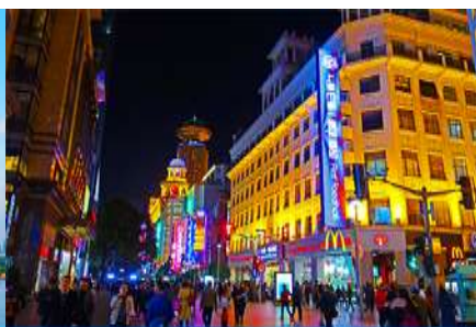
ถนนคนเดินหนานจิงอู่