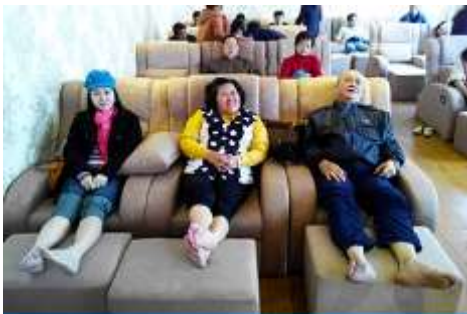
ศูนย์วิจัยแพทยแผนจีน