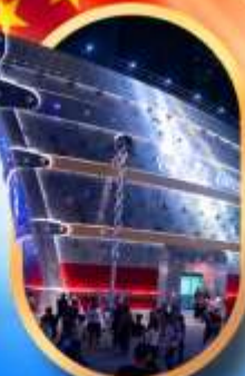
เรือคองคอง