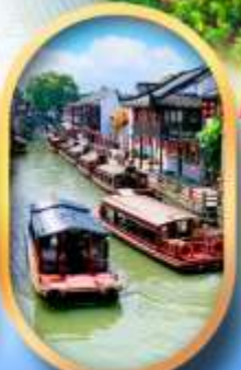
ถนนชานกิ่งเจีย