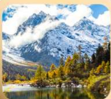
“ปี้ผิงโกว”

ชมธรรมชาติ 2 อุทยานขึ้นชื่อ อุทยานภูเขาสี่ดรุณี + อุทยานปี้ผิงโกว สะพานหนานเฉียว • ถนนคนเดินไก่อู๋หลี่ + ซุนซีลู่ + Pop Mart • ดงเจียวจื่อ