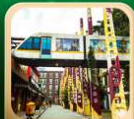
“ดงเจียวจื่อ”