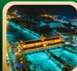
“สะพานหนานเฉียว น้ำตาสีฟ้า”