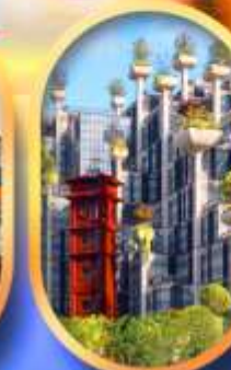
อาคาร 1,000 คัดไม้