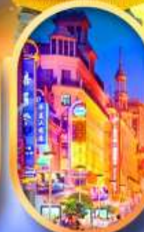
ถนนหนานกิง