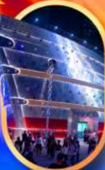
เรือคอสโพลิส