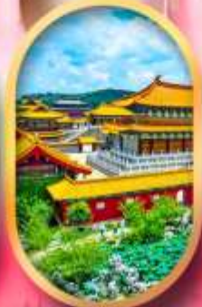
เมืองจำลองสามก๊ก