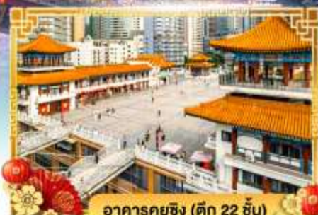
อาคารคุยฉิง (ตึก 22 ชั้น)