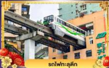
รถไฟฟ้า-สุตึก