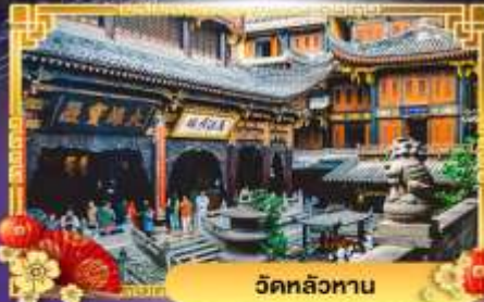
วัดหลัวหนาน