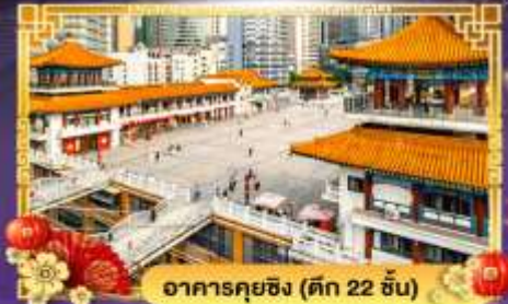
อาคารคุยซิง (ตึก 22 ชั้น)