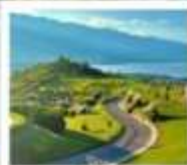
กุช่าอวี่นเซียงชาน