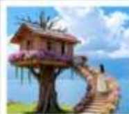
หมู่บ้านเหวินปี้