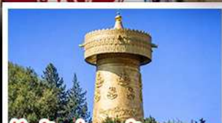
วัดต้าฝอ กงล้อมนตรา