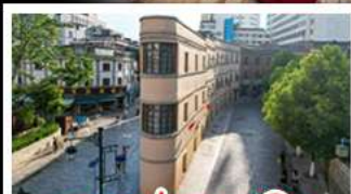
ถนนเก่าคุนหมิง