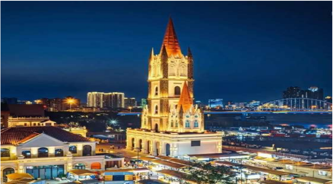
Optional ล่องเรือแม่น้ำยงเจียง ชมแสงสียามค่ำคืนของเมืองหนานหนิง ราคาท่านละ 200 RMB / ท่าน

หนานหนิงได้มีการปรับปรุงภูมิทัศน์ริมฝั่งแม่น้ำยงเจียงอย่างต่อเนื่อง ทำเรื่องถึงจื่อก็ได้รับการพัฒนาให้กลายเป็นพื้นที่พักผ่อนริมน้ำที่ผสมผสานวัฒนธรรม การท่องเที่ยว และไลฟ์สไตล์เข้าด้วยกัน โดยยังคงอนุรักษ์บรรยากาศดั้งเดิมบางส่วนไว้ พร้อมเติมเต็มด้วยงานออกแบบสมัยใหม่ จนกลายเป็นจุดถ่ายภาพยอดนิยมทั้งสำหรับชาวเมืองและนักท่องเที่ยว