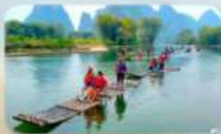
ล่องแพไม้ไผ่ที่ทง