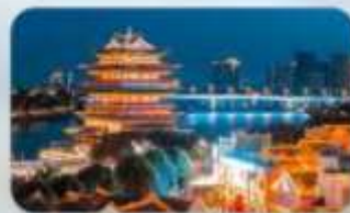
ถนนสามสายสองตอรอก