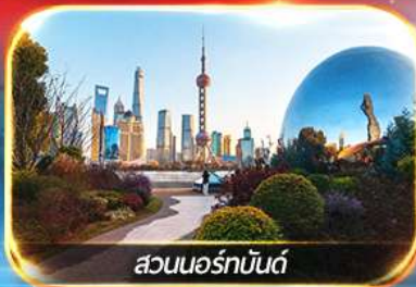
สวนออร์ทันด์