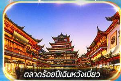
ตลาดร้อยปีเงินหวงเมียว

ถ่ายรูปชมสวนออร์ทันด์ , เชคอินหาดไว่กาน, วัดพระหยกขาว อิสระช้อปปิ้งถนนนานกิง POPMART FLAGSHIP STORE