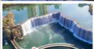
สวนน้ำตกคุณเหมิง