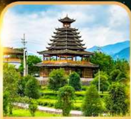
หมู่บ้านชนเผ่าตัง