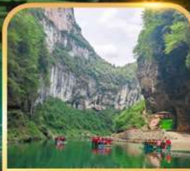
อุทยานจินหลีซาน