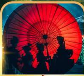
ชมแสงสีท่าเกิงหลง