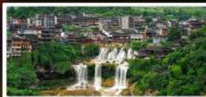
หมู่บ้านฟุทงเจิน