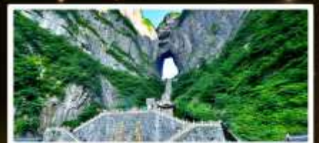
หุบเขาประตูสวรรค์