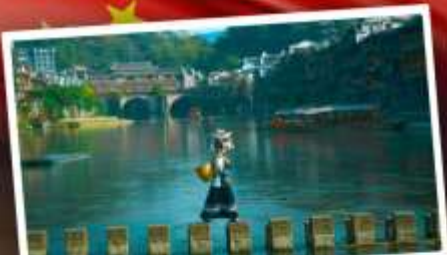
หมู่บ้านเฟิ่งทง

สุดคุ้ม!! พัก 5 ดาว ทุกคืน มนต์เสน่ห์เมืองเก่า ริมสายน้ำแห่งขุนเขา