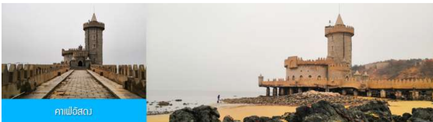
คาเฟ่อีสต

จากนั้นนำท่าน เดินทางสู่ คาเฟ่อีสต 落日古堡 นำท่านชมปราสาทในเทพนิยาย ที่ตั้งตระหง่านอยู่ริม ชายหาดนานาชาติเวย์ไห่ คาเฟ่ที่ออกแบบด้วยสถาปัตยกรรมสไตล์ยุโรป ตัดกับวิวทะเลเล็คคราม และที่นี่คือ แม่เหล็กดึงดูดนักท่องเที่ยวมาเก็บบรรยากาศความสวยงามความโรแมนติก (ตัวปราสาทเป็นร้านกาแฟ หากท่าน ต้องการเข้าไปด้านใน ต้องจ่ายค่าเครื่องดื่ม ตามเมนูของทางร้าน ซึ่งไม่รวมในอัตราค่าทัวร์)