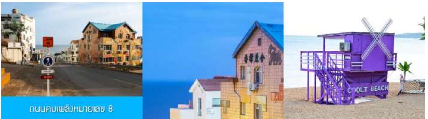
ถนนคบเพลิงหมายเลข 8

นำท่านชม สวนสาธารณะเว่ยไห่ 威海公园 สวนสาธารณะริมทะเลที่ใหญ่ที่สุดของเมืองเว่ยไห่ ให้ท่านชมและถ่ายภาพคู่กับ กรอบรูปยักษ์วิวทะเล 威海公园大相框 แลนด์มาร์คที่เป็นอีกหนึ่งไฮไลท์ฮิตของเมืองเว่ยไห่