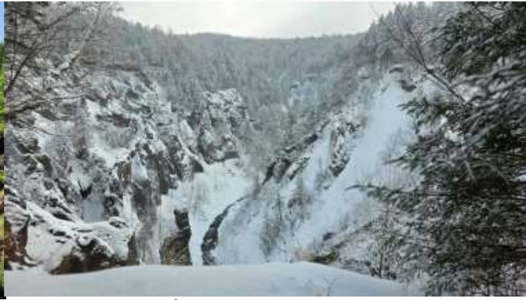
จุดชมวิวยุทธมณฑลที่มีหินรูปร่างแปลกตา และป่าไม้