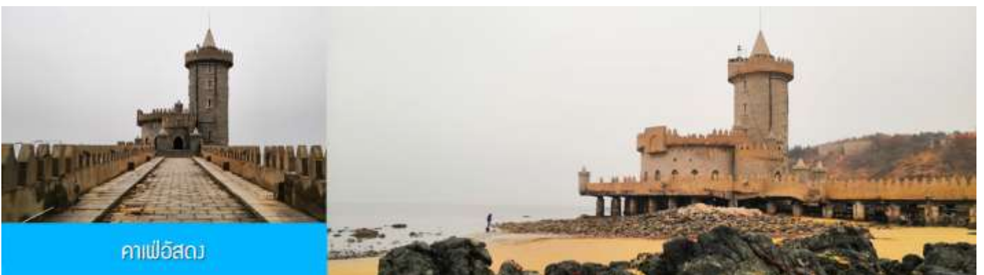
คาเฟอัสถว