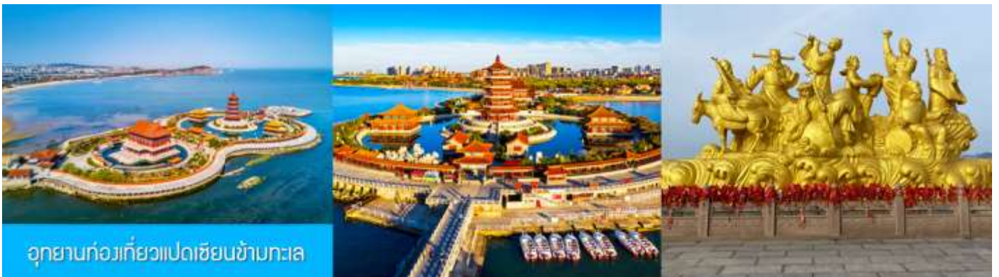
อุทยานทองเทียวแปดเซียนข้ามทะเล