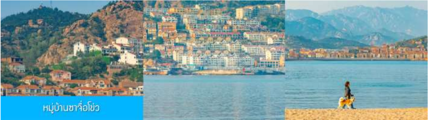
หมู่บ้านซาโจโฮว