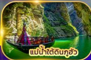
แม่น้ำใต้ดินกุอัว