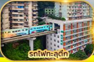
รถไฟฟ้าสุดคูล