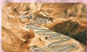
ถนนโบราณผืนหลงกุ่เต้า