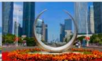
จัตุรัสฮิวเจิง

*ทางบริษัทฯ ขอสงวนสิทธิ์ในการสับโปรแกรมทัวร์ตามความเหมาะสมขึ้นอยู่กับสถานการณ์ปัจจุบัน โดยคำนึงถึงผลประโยชน์ของลูกค้าเป็นสำคัญ