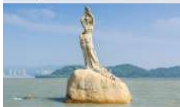
จูไห่พีชเชอร์เกิร์ล(หัวหินี่)