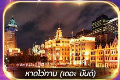
หาดว่ทาน (เดอะ บันด์)

เที่ยวดิสนีย์แลนด์เต็มวัน (รวมรถรับ-ส่ง)