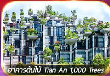
อาคารต้นไม้ Tian An 1,000 Trees