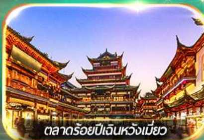
ตลาดร้อยปีเดินหวังเหมียว