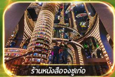
ร้านหนังสือจูกูเกอ

เที่ยวชมทัศนียภาพ 2 อุทยาน บีเฟิงโกว & ชวงเจียวโกว เชคอินแพนด้าเซลฟ์ & แพนด้าป็นตึก ซุปปิ้งจุกี่ถนคนคนเดินชุนซีลู่