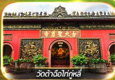
วัดต้าฉือไท่กุหลี่