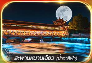
สะพานหนานเจียว (น้ำตาสีฟ้า)