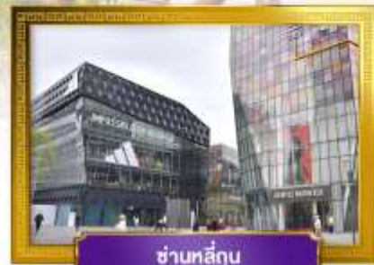
ชานหลู่กุน