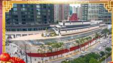
เรือหลุยส์วิคคอง