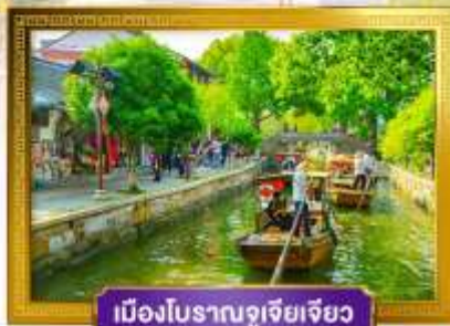
เมืองโบราณซูเจียเจียว