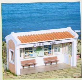
Tiaoshi Bus Station