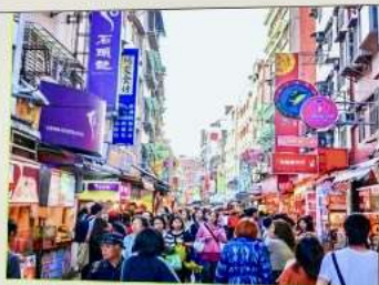
ถนนโบราณตั้นสู่ย